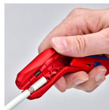
Удаление оболочки с коаксиального кабеля