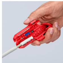
удаление оболочки с провода NYM