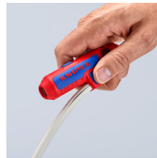
С лезвием для удобного продольного резания, скрытым в выступающем блоке с упором под большой палец