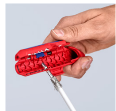
Удаление изоляции с коаксиального кабеля