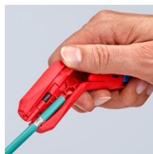
Удаление оболочки с дата-кабеля